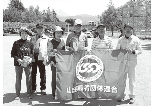
団体の部で優勝した 自治体退職者会 甲府の皆さん

今年は、現退一致の考えに基づき、連合山梨からも現役チームが参加し、OBの方々と交流を深めました。