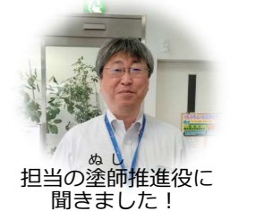
担当の塗師推進役に聞きました!